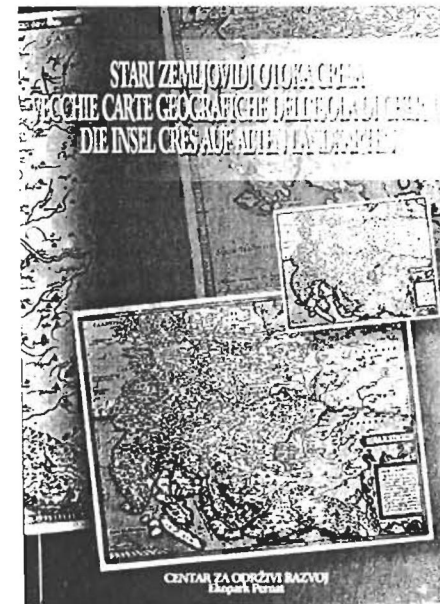
Naslovna stranica kataloga

Od prvog pojavljivanja Cresa na zemljovidima do današnjih dana proteklo je više od osamnaest stoljeća. Tijekom toga vremena