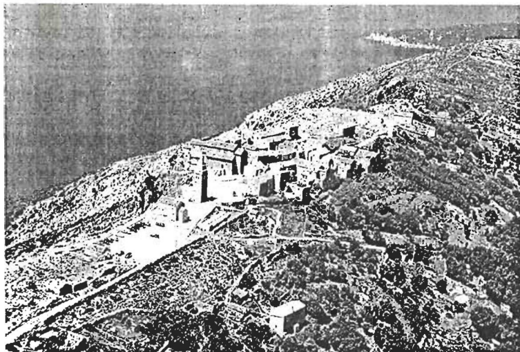
Lubenice iz zraka.

Organizator izložbe, Centar za održivi razvoj – Ekopark Pernat provodi niz projekata na području Lubenica odnosno poluotoka Pernat na otoku Cresu. Njegov je cilj da integralnim pristupom promiče očuvanje autohtonog pučkoga graditeljstva, valorizaciju prirodnog i kulturno-povijesnog naslijeđa, revitalizaciju lokalnoga gospodarstva, primjenu obnovljivih izvora energije, zaštitu okoliša, uređenje krajolika interpretacijom okoline te razvija i provodi projekte vezane za održivi otočni turizam.